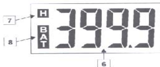
Рис.2. Дисплей на жидких кристаллах